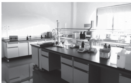
研发中心内部实验室