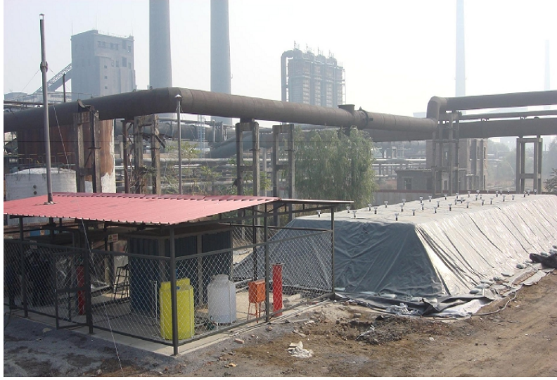
图 3 生物堆工程实际现场图